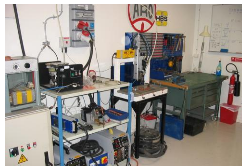
Bild från vår välutrustade serviceverkstad