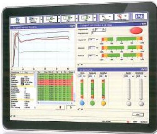
Exempel på panel (HMI) för processövervakning och programmering av svetsvakten.