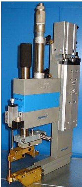
Exempel på svetshuvud