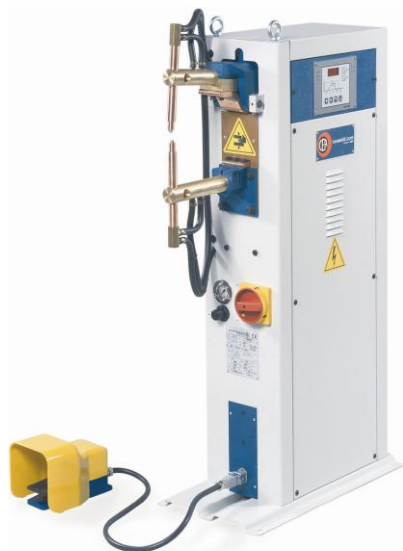
ZP, Justerbara armar i längd

Det finns två huvudtyper av dessa maskiner: