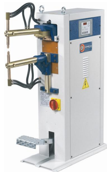
NKLT, Undre arm justerbar i höjd

ZT är manuellt pedalmanövrerad och ZP är tryckluftsmänövrerad med elektrisk fotpedal. Max plåttjocklek 3+3 mm